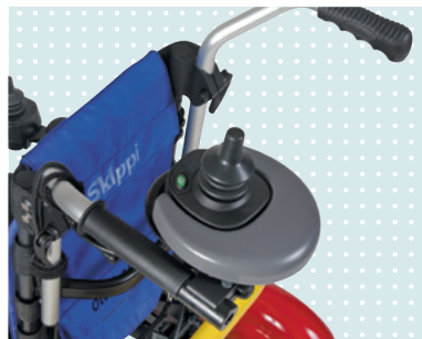
• Vezérlés kíséző részére