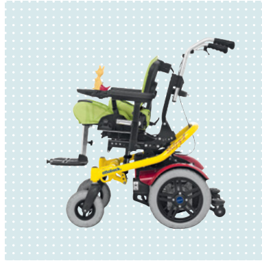
• Squiggles ültetőrendszerrel