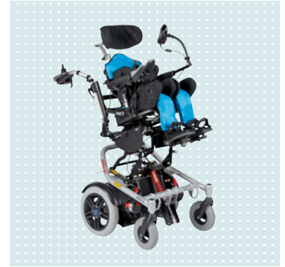
• Mygo ültetőrendszerrel