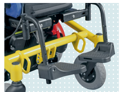
• Készlet autóban szállításhoz