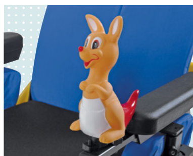
• Kézi kürt