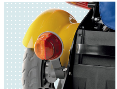
• Világítás (a német KRESZ előírásoknak megfelelően)